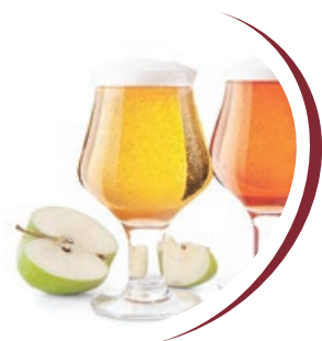
alcoolique des produits

En raison de la croissance démographique et des possibilités limitées d'augmenter la production intérieure, les importations devraient augmenter au cours de la période 2021-2030.