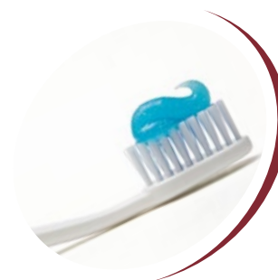
produits d'hygiène, produits de beauté

Des opportunités importantes s'ouvrent pour les expéditions de lait en poudre et condensé. Selon les prévisions, si en 2019 la pénurie de lait en Afrique était estimée à 8,9 millions de tonnes, alors en 2025. elle s'élèvera à 12,9 millions de tonnes, et en 2030 elle atteindra 17 millions de tonnes équivalent lait.