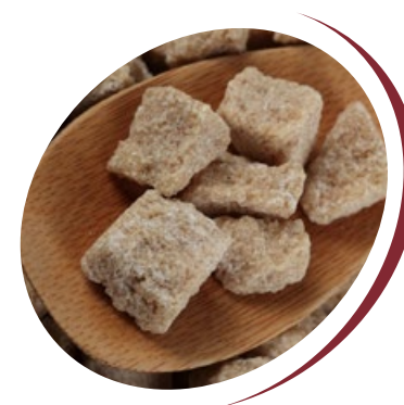
sucre de canne

Notre société a développé son propre modèle de tarification qui reflète notre vision du monde et notre compréhension de l'entreprise et prend en compte nos coûts et nos risques. Le fait que des acteurs étrangers quittent le marché a un impact positif au final.