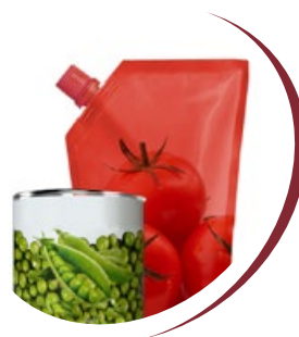
en conserve des produits