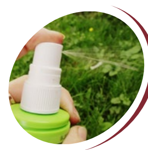
installations des moustiques